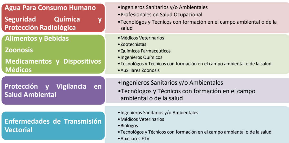
Gráfico No. 14 Perfiles del talento humano Asignación a cada ARO UESVALLE

Igualmente, dependiendo del proceso misional a desarrollarse en los municipios, se recomiendan los perfiles laborales que se muestran en la siguiente gráfica, para cada uno de ellos: