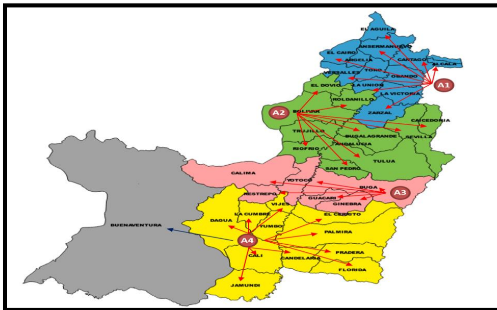
Gráfico No.6. Áreas Operativas – ARO de la UESVALLE, 2018