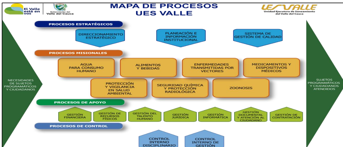
Gráfica No.4. Mapa de Procesos de la UESVALLE 2018

La Unidad Ejecutora de Saneamiento del Valle del Cauca está comprometida con la oferta y prestación de servicios de salud y saneamiento ambiental de manera oportuna, confiable y efectiva, promoviendo una cultura de calidad en el servicio y la efectividad en la comunicación con la comunidad, con las personas competentes y racionalización de los recursos que garanticen la satisfacción de los clientes, mejorando continuamente los procesos y las competencias personales. Para tal fin, cuenta con el siguiente mapa de procesos distribuido en componentes estratégicos, misionales, de apoyo y de control, como se evidencia en el siguiente gráfico: