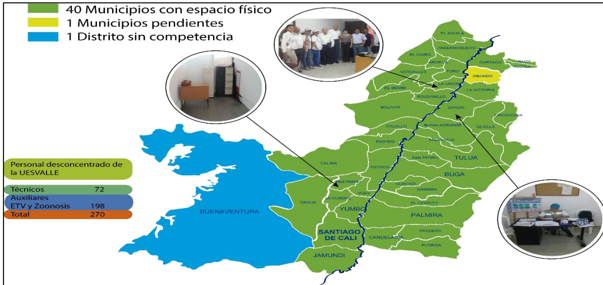
Gráfico No.3. Desconcentración técnica de la UESVALLE en los municipios

La Unidad Ejecutora de Saneamiento del Valle del Cauca está comprometida con la oferta y prestación de servicios de salud y saneamiento ambiental de manera oportuna, confiable y efectiva, promoviendo una cultura de calidad en el servicio y la efectividad en la comunicación con la comunidad, con las personas competentes y racionalización de los recursos que garanticen la satisfacción de los clientes, mejorando continuamente los procesos y las competencias personales. Para tal fin, cuenta con el siguiente mapa de procesos distribuido en componentes estratégicos, misionales, de apoyo y de control, como se evidencia en el siguiente gráfico: