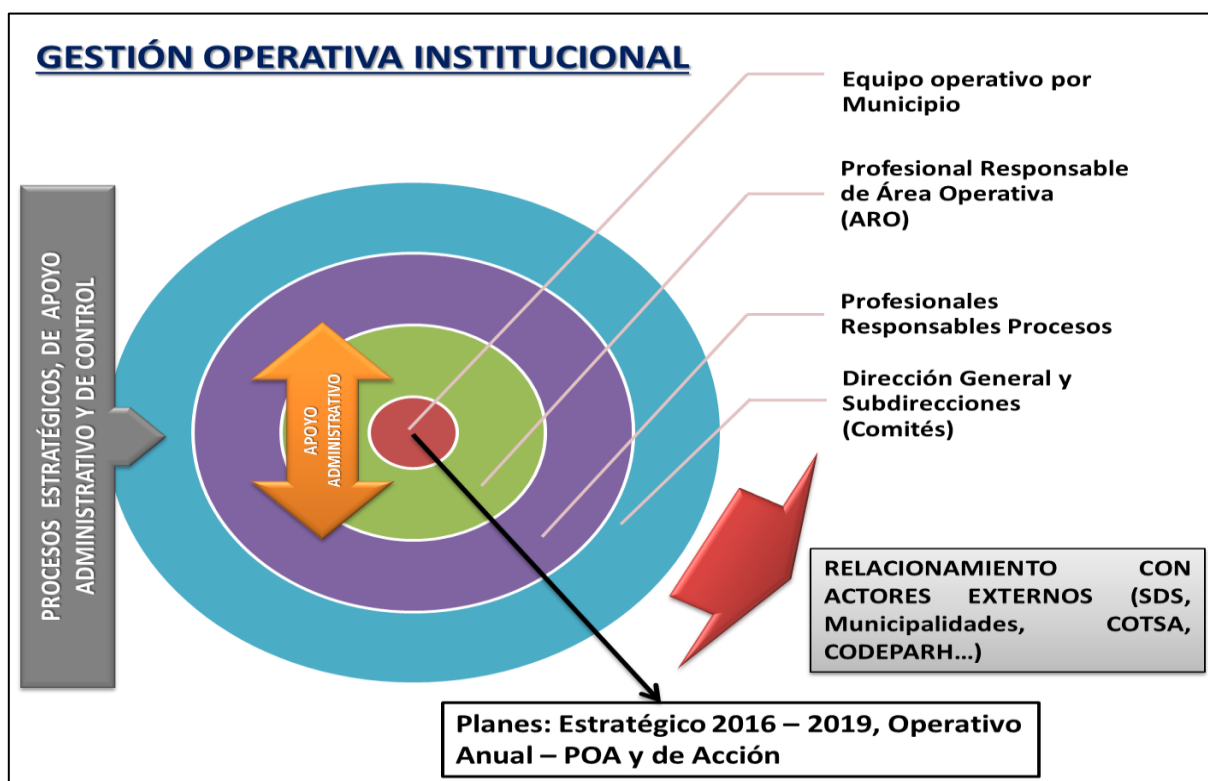
Gráfico No. 5. Modelo Institucional de Gestión Operativa – MIGO UESVALLE 2018

Teniendo en cuenta lo anterior, luego de revisar la situación actual de la UESVALLE en cuanto a la distribución territorial y operativa establecida, que permite dar cobertura a cada uno de los municipios para el cumplimiento de las responsabilidades asignadas en materia de salud ambiental y saneamiento ambiental; se establece en el gráfico siguiente, el Modelo Institucional de Gestión Operativa – MIGO, con el cual se busca avanzar en la consolidación de los mecanismos existentes y garantizar una mayor eficacia, efectividad y oportunidad en la ejecución de cada una de las actividades programadas para los equipos técnicos ubicados a nivel territorial.