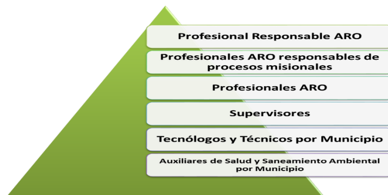
Gráfico No. 13 Estructura jerárquica del talento humano por ARO UESVALLE

Igualmente, dependiendo del proceso misional a desarrollarse en los municipios, se recomiendan los perfiles laborales que se muestran en la siguiente gráfica, para cada uno de ellos: